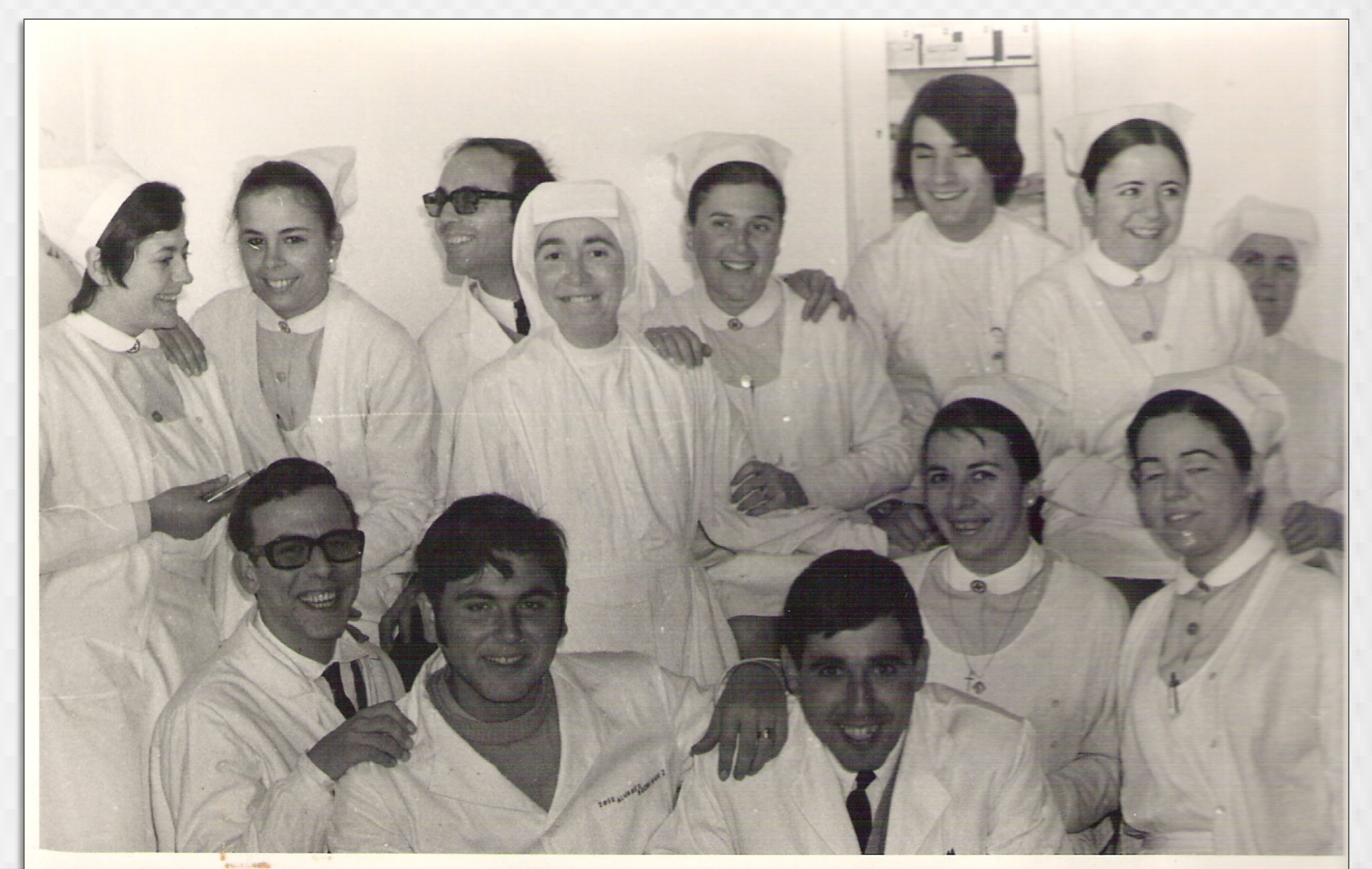
IMAGEN 5.8. Personal de Enfermería del Hospital a finales de los años 60