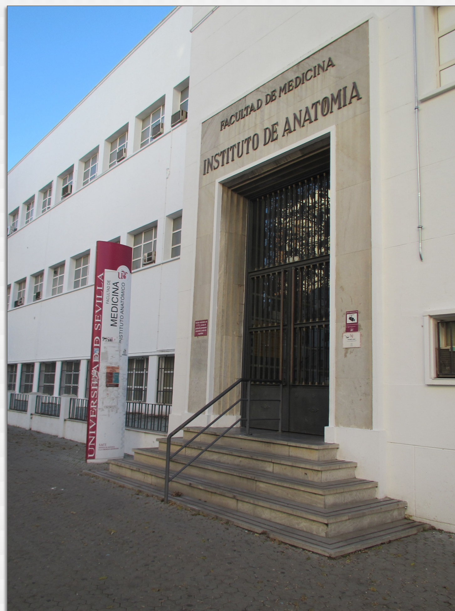
IMAGEN 5.6. Instituto de Anatomía. Facultad de Medicina de Sevilla. Este Centro se hace cargo de las enseñanzas de Enfermería impartidas en el antiguo Hospital de las Cinco Llagas